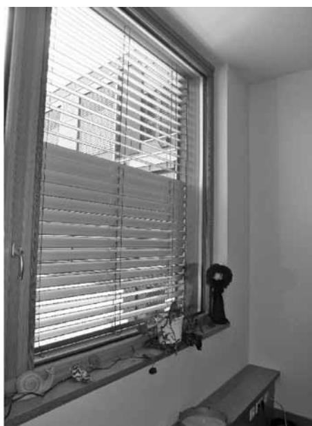
Slika 3: Nastavljive žaluzije – v zgornjem in spodnjem delu so lamele odprte za odboj svetlobe v strop in od tam v globino prostora, v srednjem delu zaprte za zaščito pred pregrevanjem