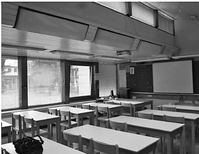
Slika 2: Enakomerna distribucija dnevne svetlobe z nadsvetlobo in senčili, ki omogočajo delni pogled navzven