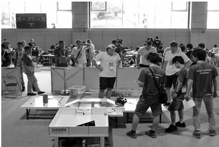
Slika 3: Tekmovanje RoboCup Rescue Line

Julija 2017 smo se udeležili svetovnega prvenstva v mobilni robotiki RoboCup 2017 v Nagoji na Japonskem. Mednarodne ekipe so predstavljale svoje raziskovalno delo na področju mobilne robotike. Dijaki so tekmovali v različnih kategorijah, naša skupina dijakov je tekmovala v kategoriji RoboCup Rescue Line (RoboCup 2017). Njihovo uspešnost so ocenjevali ocenjevalci, ki so pri oceni uspešnosti ekip upoštevali tudi kategorijo mednarodne vključenosti ekipe. Cilj tako tvorjenih mednarodnih ekip je bil reševanje splošnih problemov mehatronike. Ekipe so morale v kratkem času rešiti problem oz. se rešitvi problema čim bolj približati. Pri tem je bilo ključnega pomena skupinsko delo z izmenjavo mnenj, idej in predlogov, ki lahko skupino vodijo do uspeha. Skupine dijakov so morale izkazati znanja tako na področju splošnih ved (matematike in poznavanja tujih jezikov) kot na širokem interdisciplinarnem področju mehatronike (elektrotehnika, mehanika, računalništvo itd.). Pri tem so dijaki skozi vzpostavitev medkulturnega dialoga in novih prijateljstev spoznali kulturo drugih držav in mentaliteto njihovih prebivalcev. Pri navedenih dveh primerih mednarodnega sodelovanja je zelo pomembna praktična pozitivna izkušnja tudi za učitelja. Učitelj pri tem pridobi nova znanja, ki jih uporablja pri svojem nadaljnjem pedagoškem delu ne le pri vključenih dijakih, temveč pri vsakodnevnem delu v razredu.