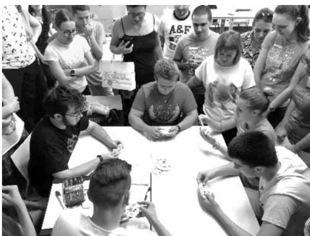
Slika 2: Mednarodni kamp robotike, mednarodne projektne skupine rešujejo intelektualne izzive

projektno usmerjenega reševanja problemov. Ekipe so se udeležile najrazličnejših interdisciplinarnih delavnic, izobraževanj in zanimivih strokovnih predavanj ter predstavitev primerov dobrih praks mednarodnega povezovanja. Udeleženci so spoznali gradnjo in programiranje mobilnih robotov, pri tem so izmenjavali mnenja, ideje in predloge znotraj mešanih ekip. Dijake smo na skupinsko delo v mednarodnih skupinah pripravljali tako, da smo jih ustrezno usposobili v komuniciranju v tujem, angleškem jeziku. V tem primeru se učitelji strokovnih predmetov povežemo z učitelji splošnih predmetov. Dijakom smo predstavili pomembnost sprejemanja mnenj in idej znotraj kulturno mešanih ekip, kar lahko raznoliko skupino pripelje do boljših rešitev. V ta namen smo predhodno organizirali delavnice, izobraževanja in posvet o mednarodnem sodelovanju med Srednjo šolo za strojništvo, mehatroniko in medije ter Fakulteto za strojništvo Univerze v Mariboru. Na teh dogodkih so dijaki spoznali pomembnost kulturne raznolikosti in internacionalne povezanosti, predstavljenih na primerih dobrih praks. S pomočjo predhodno pridobljenega znanja so dijaki v mednarodnih ekipah reševali različna intelektualna vprašanja, se povezovali, komunicirali v tujem jeziku, rezultati pa so bili domiselne ideje in rešitve. Mednarodno sodelovanje, skupinsko delo in izmenjava mnenj, idej ter predlogov so prikazani na Sliki 2.